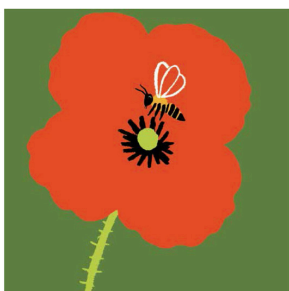
なかなか ひなげしのなか だーれだ？ わたしは みつぼち