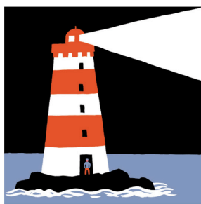
なかなか とうだいのなか だーれだ？ わたしは みほりぼん