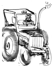
◀食卓でイネを想う（里編より）