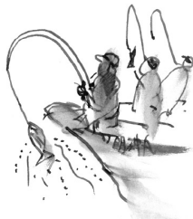
鯉節のひみつ（海編より）

からだの芯をつくるのは、 これとってかわりばえしない ふだんの食事なのだ。（本文より）